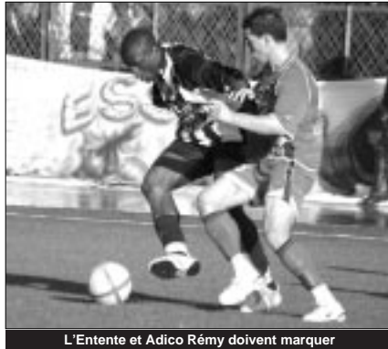
L'Entente et Adico Rémy doivent marquer

points, l'Entente n'a plus qu'un seul objectif : assurer sa qualification. Le moindre point est toujours bon à prendre. Un match nul ferait bien son affaire. Les Sétifiens vont affronter un adversaire très dangereux, qui va certainement privilégier son secteur offensif en vue d'augmenter son capital de points. L'équipe jordanienne dispose de plusieurs choix offensifs capables de trouver les failles chez l'adversaire et de les concrétiser en buts. Sur un autre chapitre, le club d'El Faycali occupe actuellement la 133 e place, avec 105 points, dans le classement international des clubs initié mensuellement. Occupant auparavant la 151 e place, le club jordanien a glané 18