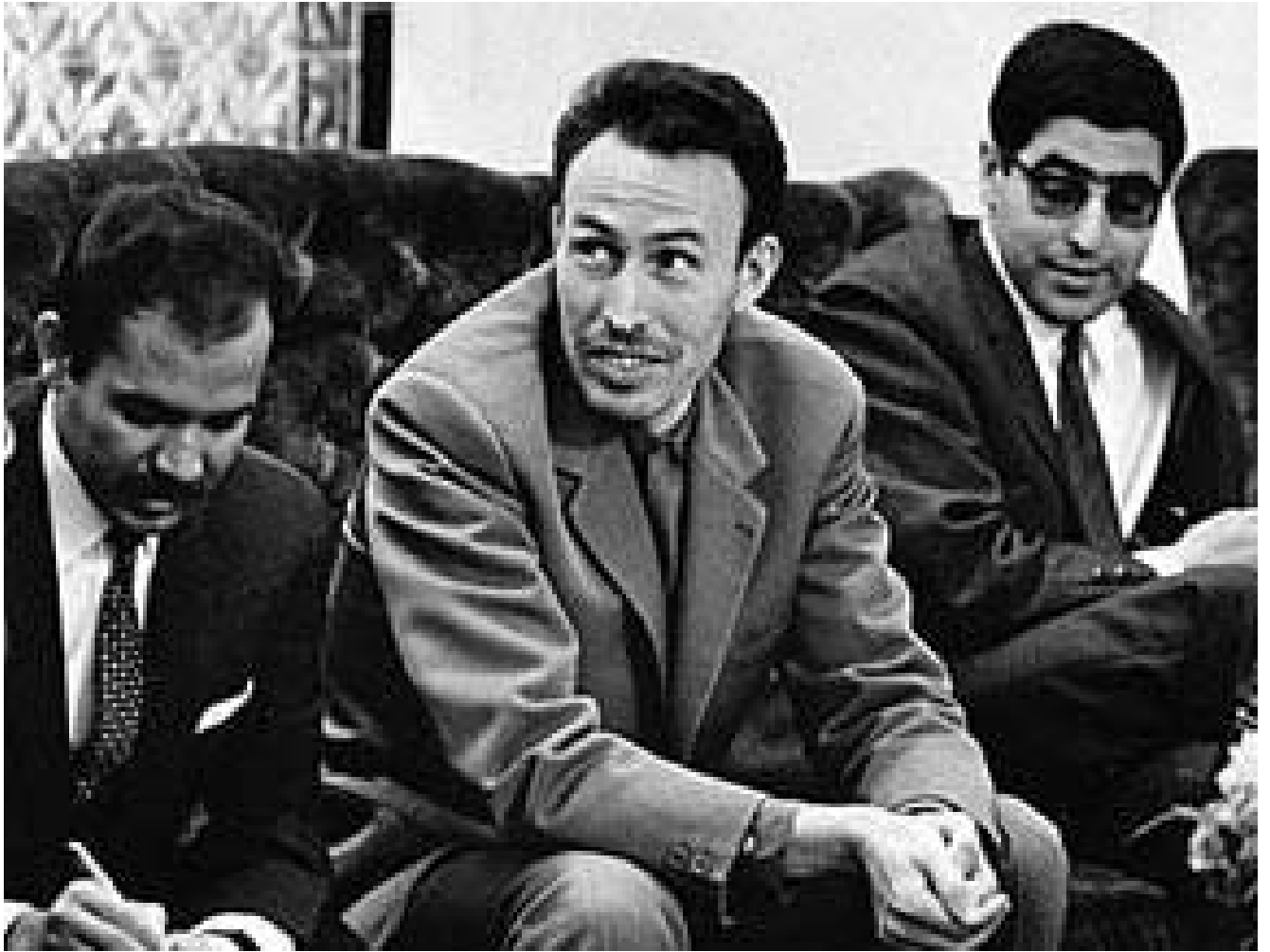
Houari Boumediène entouré de Abdelaziz Bouteflika et Cherif Belkacem, le « noyau dur » en partie...

PB : Il est incontestable que vers la fin de son règne, Houari Boumediène avait été gagné au goût de l'action diplomatique. Il voulait donner à l'Algérie une place qu'elle n'avait jamais occupée auparavant sur la scène internationale. Le Sommet des Non-alignés de 1973 a constitué une étape fondamentale qui a servi de tremplin. L'apothéose de ce redéploiement diplomatique fut, incontestablement, la participation de Houari Boumediène, en avril 1974, à la Session spéciale de l'Assemblée générale de l'ONU où il a prononcé un discours mémorable sur le Nouvel ordre économique international. Le voyage effectué aux Etats-Unis en 1974 reste, à cet égard, un modèle de perfection dans l'organisation matérielle, mais aussi dans la préparation de la substance des entretiens. Regardez le visage épanoui du Président algérien, à l'époque, pour vous convaincre du sentiment de revanche au