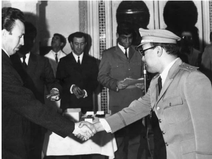
Houari Boumediène décorant un officier de l'ANP

réellement. Il est choisi, successivement, pour commander le COM Ouest dès 1958 puis, en 1960, il est désigné Chef de l'Etat-Major Général de l'ALN, nouvellement mis en place. MCM : Peut-on déceler déjà ses orientations idéologiques ou, à défaut, ses projets politiques ? PB : A propos d'idéologie, il serait présomptueux de parler, pour l'époque, d'un débat d'écoles. Tous les maquisards étaient animés, exclusivement, par l'idéal de l'indépendance nationale. Cela étant, Houari Boumediène, très avare de confidences forge, peu à peu, ses convictions. Il se méfiait, secrètement, des hommes politiques,