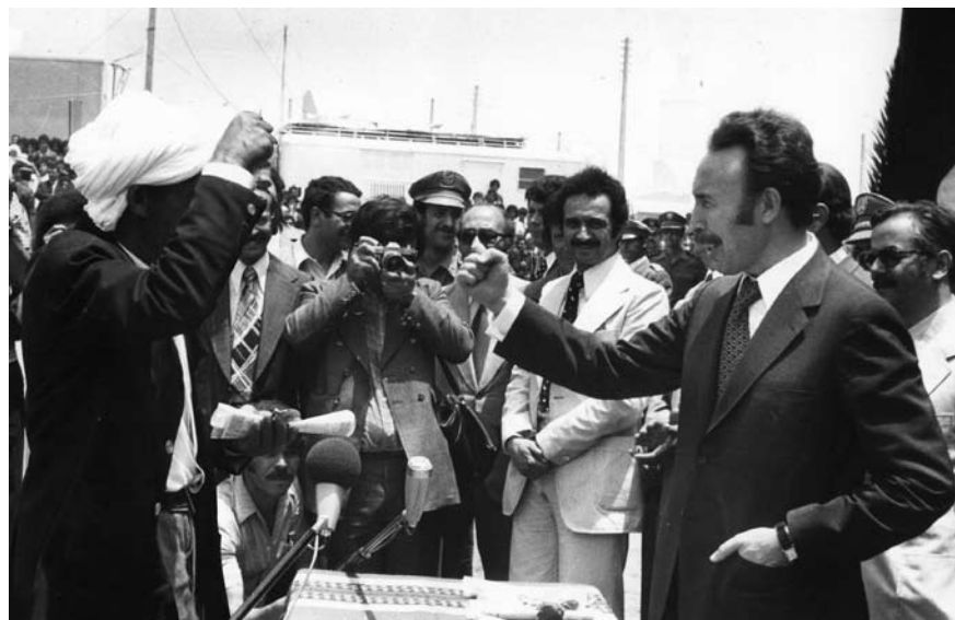
Houari Boumediène s'entretenant avec un fellah