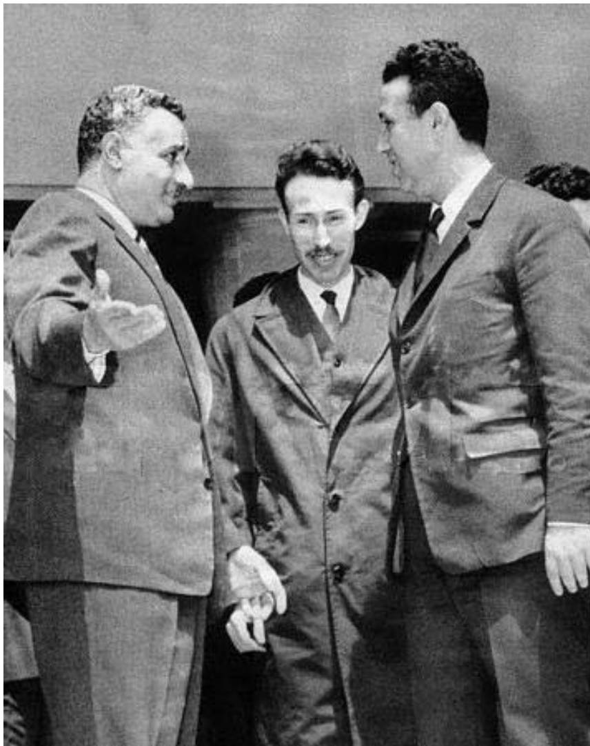
Houari Boumediène entre Nasser et Ben Bella