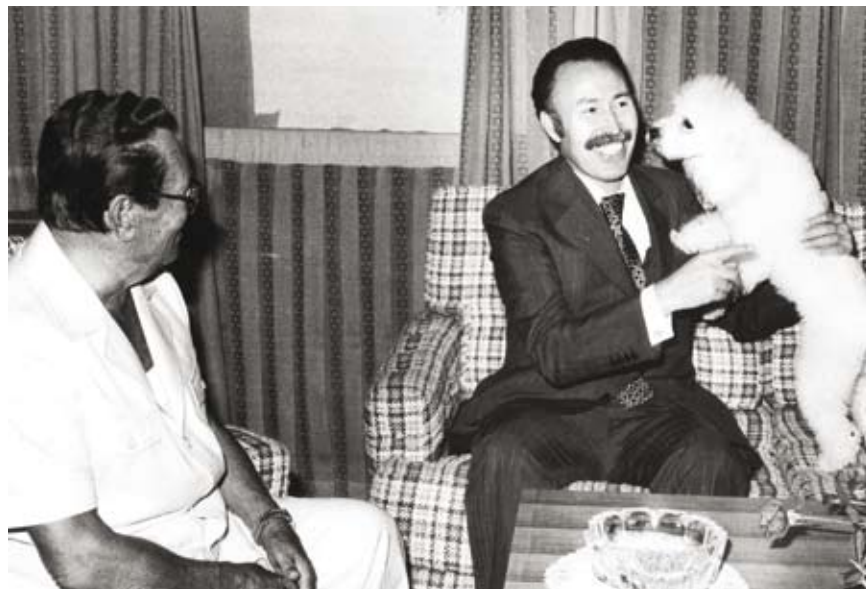
Houari Boumediène avec Tito

MCM : Houari Boumediène avait-il pour modèle des personnages de l'histoire ? PB : Des membres de sa famille m'ont indiqué qu'il se référait, souvent, à Omar Ibn El Khettab, compagnon du prophète, connu pour son esprit de rigueur et de justice... Je sais, par ailleurs, il me l'a dit, qu'il éprouvait du respect pour le Roi Fayçal d'Arabie ainsi que le Président Nasser. Encore qu'il ait reproché à ce dernier d'avoir manqué de clairvoyance et de fermeté dans la gestion des questions militaires. Il m'a été rapporté, également, qu'il aimait citer dans ses moments d'inspiration au siège de l'Etat-Major Général de l'ALN à Ghardimaou la phrase de Saint Just, un des artisans de la Révolution française de 1789 : «Ceux qui font les révolutions à moitié creusent leurs propres tombes ». De manière plus