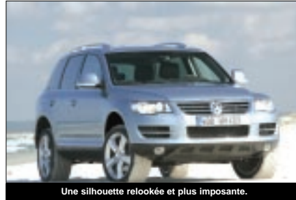
Une silhouette relookée et plus imposante.

toute évidence une forte expression de bien-être et de confort avec des espaces plus que généreux et un réglage autonome des principaux instruments, telle la climatisation.