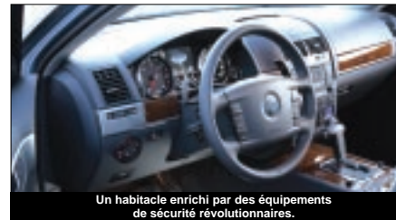
Un habitacle enrichi par des équipements de sécurité révolutionnaires.

Le Side Scan, ou assistant de changement de voie, est une autre offre technologique sur Touareg qui consiste à alerter le conducteur d'un potentiel danger en cas de dépassement ou de changement