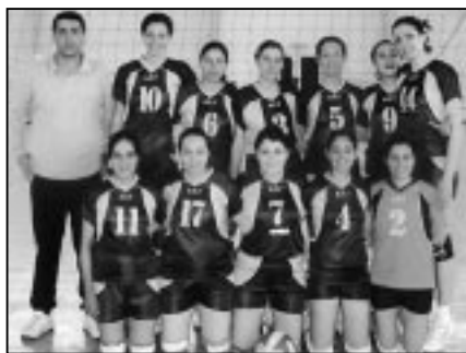
L'AC Tizi-Ouzou : des ambitions à en revendire.

En berne depuis un temps que l'on ne se remémore plus, le sport féminin est en train de revivre à Tizi-Ouzou par la grâce de la jeune formation de l'Athlétique club de Tizi-Ouzou (ACT).