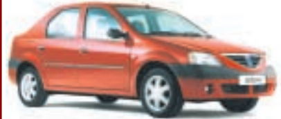
La Dacia Logan s'impose de plus en plus.