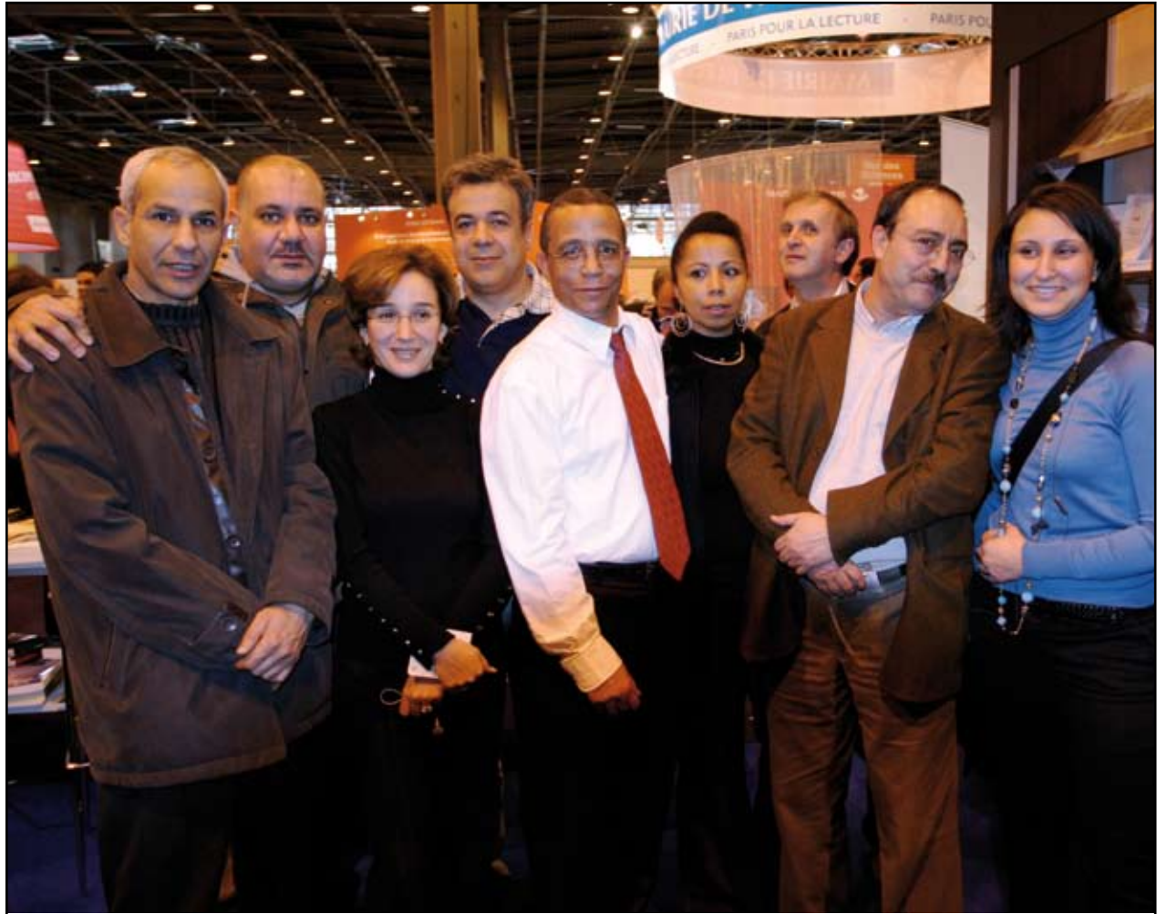
Yasmina Khadra au Salon International du Livre à Paris

qu'ils ne connaissent pas et s'en attachent. Contrairement à ce qu'avancent certains frères, qui pensent amoindrir l'importance de mon travail en le situant dans ce qu'ils appellent l'écriture de l'urgence (encore un caractère de complexés !), mes romans sont porteurs d'une âme, d'une émotion et d'un imaginaire exceptionnels. Ce qui explique l'engouement qu'ils suscitent aussi bien au Japon qu'en Inde, en Afrique qu'en Scandinavie, aux Amériques qu'en Europe de l'est. J'entends d'ici certains crier à la mégalomanie. Il ne s'agit aucunement d'une quelconque fanfaronnade. L'internet existe. Il suffit d'aller sur Google, de choisir une préférence, c'est-à-dire un pays et de taper mon nom. Par enchantement, on a accès à tous les sites qui parlent de mes livres. Si ça peut les rassurer, il existe quelques sites hostiles, sionistes et arabes, des descentes en flammes magnifiques, splendides, et mes frères que j'adore et qui ne m'aiment pas pourraient y prendre leur pied. Je ne suis pas mégalomanie. Je suis sincère. Je parle de moi comme d'un étranger. Sans passion ni fausse modestie. Je ne laisserai personne se substituer à moi. Je réagis là expressément pour contrecarrer certains de mes compatriotes chéris qui hiérarchisent, font et défont à leur guise la qualité ou