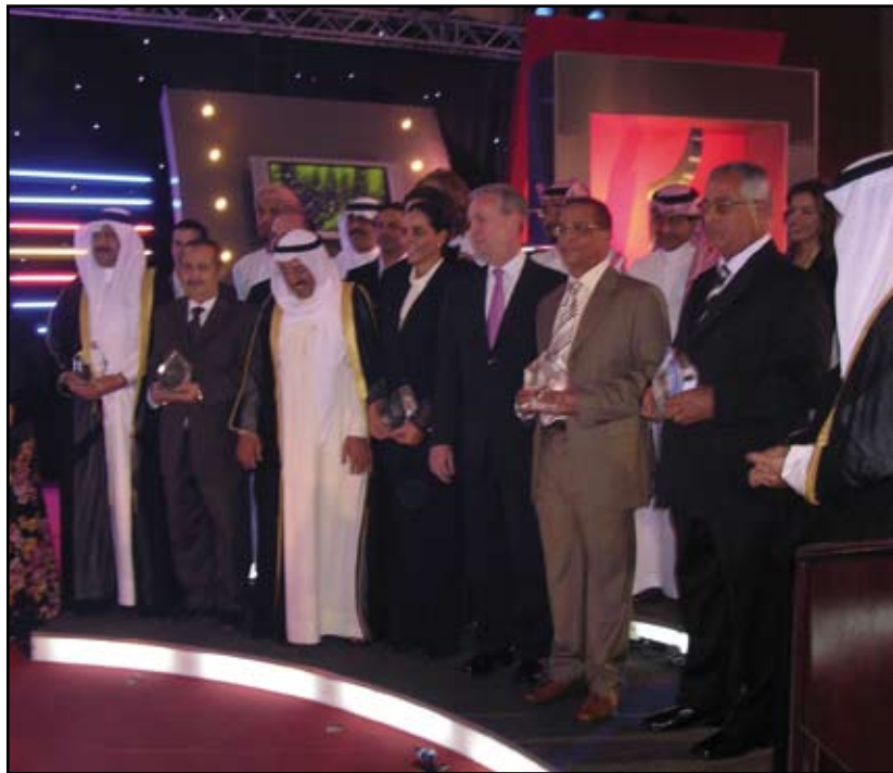
Yasmina Khadra récompensé à Koweït City

de salaud et rectifient le tir. Ne reste que le poids du parjure et la marque indélébile de l'opprobre. Bien sûr, le combat continue ; il reste encore quelques poches de résistance, mais tout le monde sait pourquoi certains s'entêtent. Ils s'entêtent par dépit. Ils savent qu'ils ne font pas le poids, alors ils font la fine bouche. Pour ma part, je me porte bien. J'ai des lecteurs qui m'encouragent, et des critiques qui me soutiennent. Ainsi est la vie. Il faut un peu de tout pour faire un monde : des braves et des bêtes immondes, des justes et des fourbes, des géants et des gnomes, des Algériens splendides et de sordides Algériens. Je sais où est mon camp, je sais qui sont les miens.