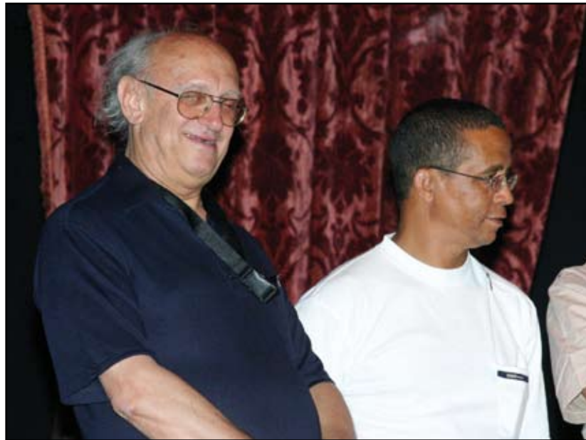
Yasmina Khadra en compagnie de l'écrivain grec Petros Markaris

France, je suis passé à dix sept. L'an dernier, j'étais à vingt quatre pays. Cette année, je suis traduit dans plus de trente pays... Pourquoi ?...Parce qu'il y a toujours une justice sur cette terre. On ne voile pas le soleil avec un tamis et ne reste dans le lit de la rivière que ses galets. Quelqu'un