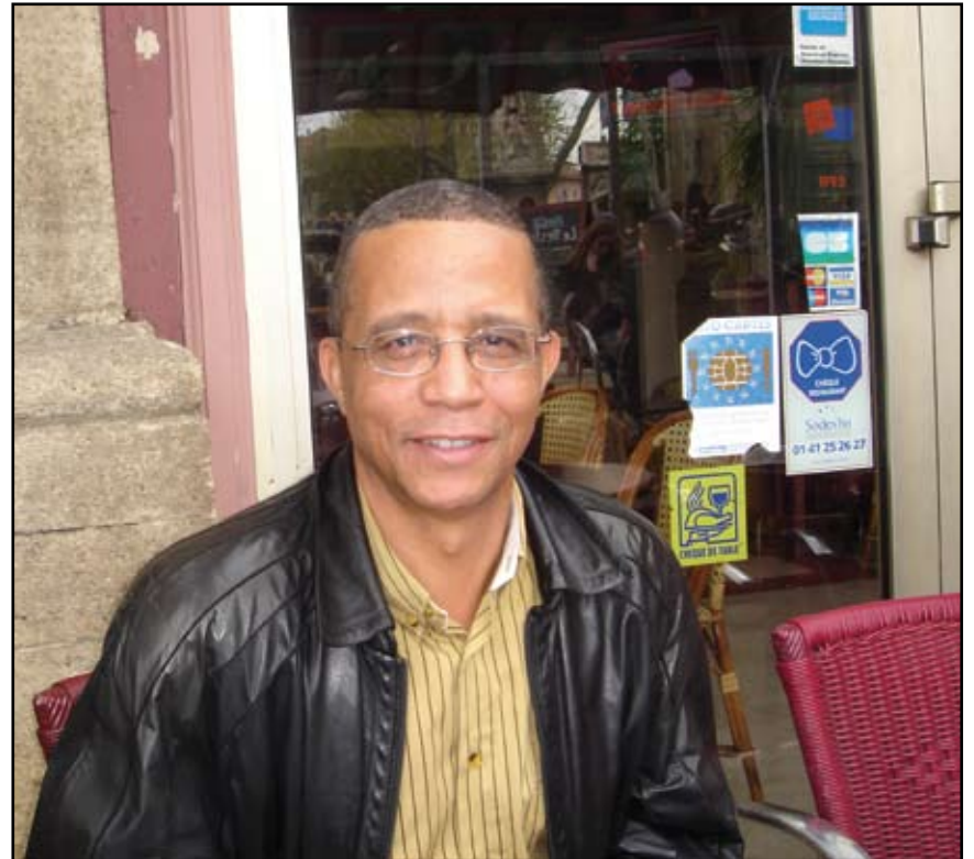
Yasmina Khadra au coeur historique d'Aix-en-Provence

mina Khadra. Comment lui vient l'inspiration des thèmes qui essaient ses romans ? On l'aura compris, la violence est au cœur des romans de Yasmina Khadra. Mais pédagogique, il tempère : « A travers mon livre je prends l'Occidental par la main et je l'amène au commencement du malentendu, au plus proche de cet homme qui, un jour, décide de se faire sauter au milieu d'innocents ». Il considère avoir accompli son œuvre : « Il n'y aura pas de suite à cette trilogie consacrée au malentendu entre l'Orient et l'Occident ». Examinons à présent la technique de l'écriture chez Yasmina Khadra ou la flamboyance du verbe la dispute à peine à cette esthétique tour à tour saccadée, hachée ou torrentielle, selon l'humeur et qui vous subjugue de bout en bout d'un récit qui se donne à découvrir à chaque nouveau parcours que vous en faites. Lui reproche-t-on de s'intéresser à des thèmes qui captivent les Occidentaux plutôt que ses concitoyens ? Il se défend sans perdre pied : « je ne voulais pas donner un nom arabe à la violence, argue-t-il, car elle est partout humaine »... C'est, arpent de terre par arpent de terre, en effet, que Yasmina Khadra défend, l'arme au poing allais-je me hasarder, son terrain vital. Il le fait avec un grand bonheur même si c'est au prix d'une férocité