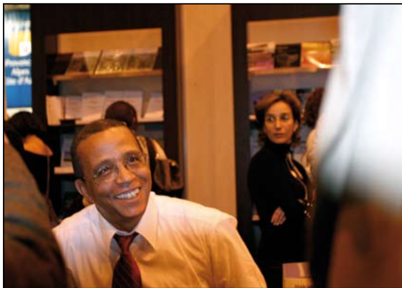
Yasmina Khadra heureux avec ses lecteurs