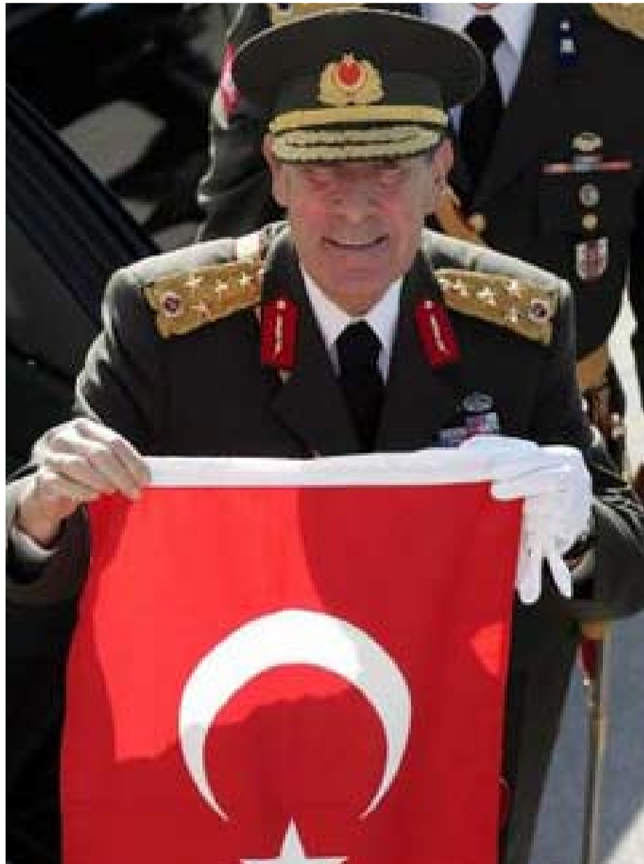
Le Chef de l'Etat major turc, l'emblème national à la main, toute symbolique...

vèlerait que le ressort principal en est le culte de l'idée nationale, un patriotisme exacerbé construit autour du projet de rédemption de la Turquie. A travers la réhabilitation de l'État et grâce à la restauration de la puissance économique et militaire du pays. Et en aucune manière, l'instauration de la démocratie. C'est ainsi que le régime mis en place par Kemal ATATURK a, longtemps, oscillé entre l'autoritarisme et une pure façade démocratique ? Comment s'est rétabli, peu à peu, l'équilibre entre l'autoritarisme qui avait caractérisé les premiers pas de la démarche de Kemal ATATURK et le régime multipartite qu'il a légué à sa mort ?