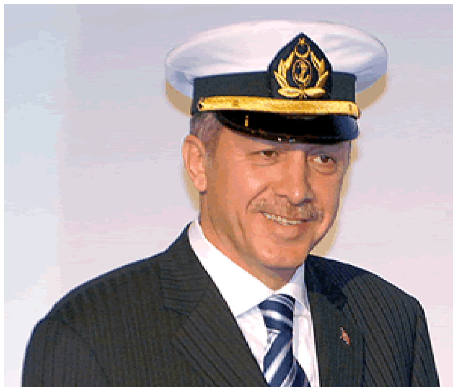
Tayyip ERDOGAN, leader du mouvement islamiste et chef du gouvernement en Turquie avec une casquette militaire : une situation d'expectative ?

MCM : La Turquie a toujours présenté un profil utile pour la stratégie extérieure américaine, notamment par rapport aux impératifs opérationnels du dispositif militaire de l'OTAN. Au départ, le territoire turc était un lieu privilégié pour surveiller l'avancée de l'empire communiste vers « les mers chaudes ». L'importance de ce territoire s'est accrue encore plus depuis que les circuits d'approvisionnement en pétrole y transitent, nécessairement. La Turquie, par ailleurs occupe une position stratégique pour contrôler l'eau dans la région, véritable enjeu du futur. Après le démantèlement de l'Union Soviétique, ces considérations sont, paradoxalement, encore plus présentes. La Russie de Poutine est animée, en effet, par les mêmes ambitions que la Russie tsariste. L'équilibre instable qui caractérise la situation au Proche-Orient consolide, en effet, la position stratégique de la Turquie, poste avancé de l'OTAN dans la région. Cela donne à la Turquie, selon vous le statut de partenaire incontournable ou d'allié stratégique pour les USA pour le flanc sud de l'OTAN ? S.O : Vous avez raison de citer l'importance de la Turquie du point de vue du contexte géostratégique. Tant que la Turquie demeurera un associé de l'oc-