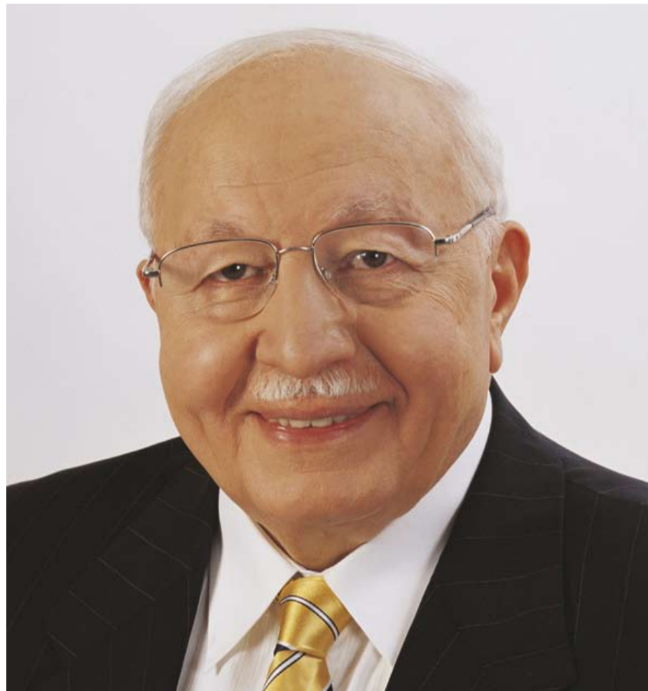
Mehdi ERBAKAN, leader islamiste à l'origine de l'aggiornamento du mouvement islamiste turc

S.O : Je poserai différemment la question. L'État turc est laïc - aussi limité ou particulière que puisse paraître sa laïcité - mais cet État ne peut pas encore accéder au statut d'État laïc. Certes, la société peut, au fur et à mesure du temps, devenir laïque lorsque ses structures traditionnelles auront disparues. La Turquie évolue, graduellement, vers le statut d'un pays capitaliste où les questions religieuses occupent l'esprit des gens car, l'être humain aussi pieux soit-il reste un acteur économique. Je pense que ce schéma d'évolution est classique. Pour ce qui concerne les confréries religieuses, celles-ci ont accompli, aussi, un rôle dans l'intégration de la partie religieuse de la population dans l'économie capitaliste à travers les réseaux de solidarité qu'elles ont mis en place. Ces confréries religieuses n'interviennent pas comme des organisations religieuses