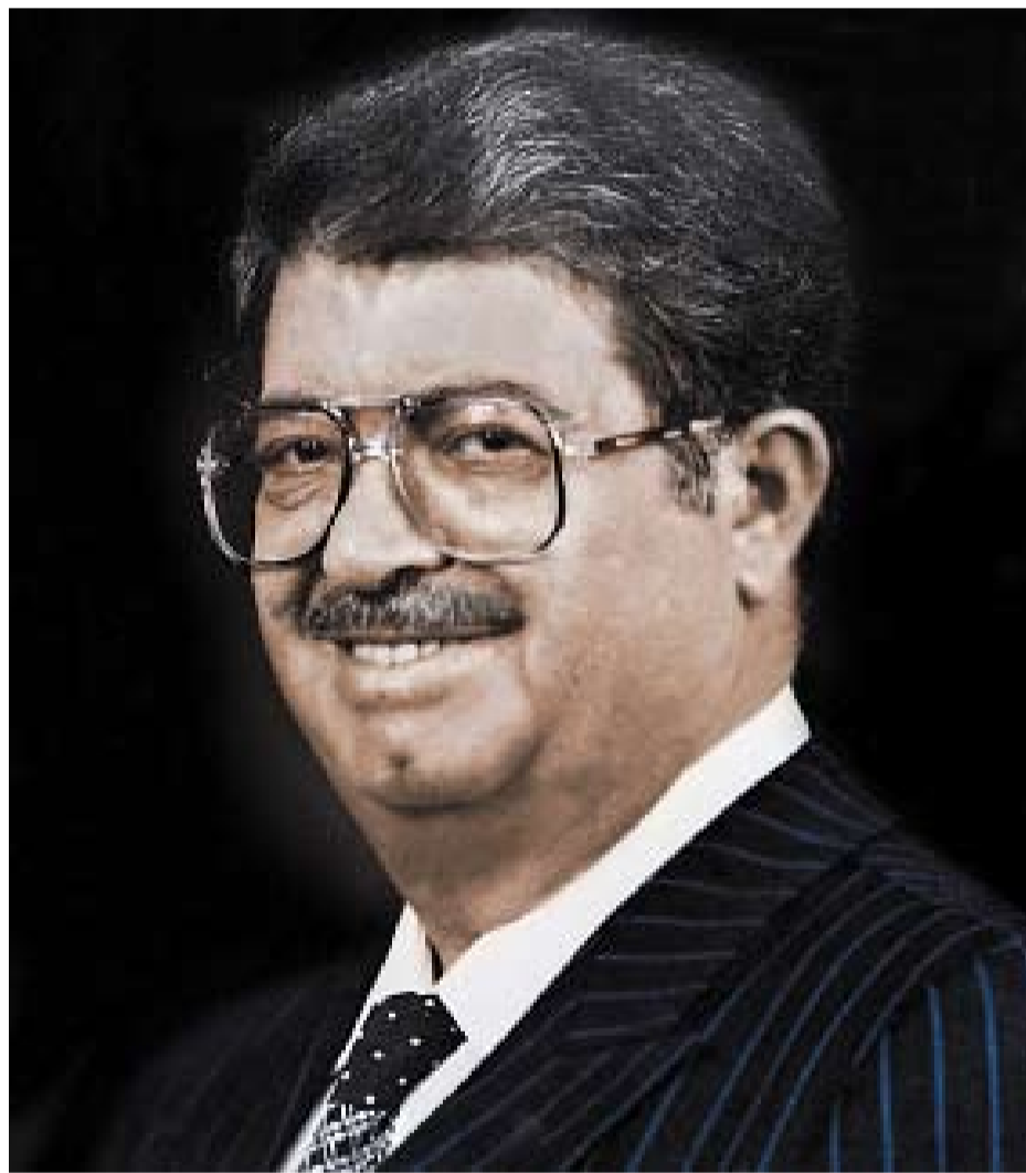
Turgut OZAL, un leader politique qui a affronté, à son avantage, les militaires turcs...

un moyen de prévention contre les fautes des civils. J'ai déjà indiqué comment la grande bourgeoisie telle que représentée au sein du patronat turc, s'est tracée elle-même le chemin de l'adhésion à l'Union Européenne, un chemin qui passe par l'abrogation du régime militaire. Pour ce qui concerne le Conseil de Sécurité National, il n'est plus, depuis les réformes de 2003-2004, comme il était en 1997. Son Secrétaire Général est un civil de même que la plupart de ses membres. Il est évident que les militaires ne considèrent plus ce conseil comme un moyen d'exprimer leurs préoccupations et d'imposer leurs avis. Il faut prêter attention, ces jours-ci au site internet de l'État Major qui, à lui-seul, peut permettre de mesurer le changement intervenu dans le pays ainsi que le degré d'évolution auquel il est parvenu. MCM : Trois considérations semblent pouvoir expliquer l'efficacité du rôle institutionnel de l'armée turque. Sur le plan idéologique, l'armée turque