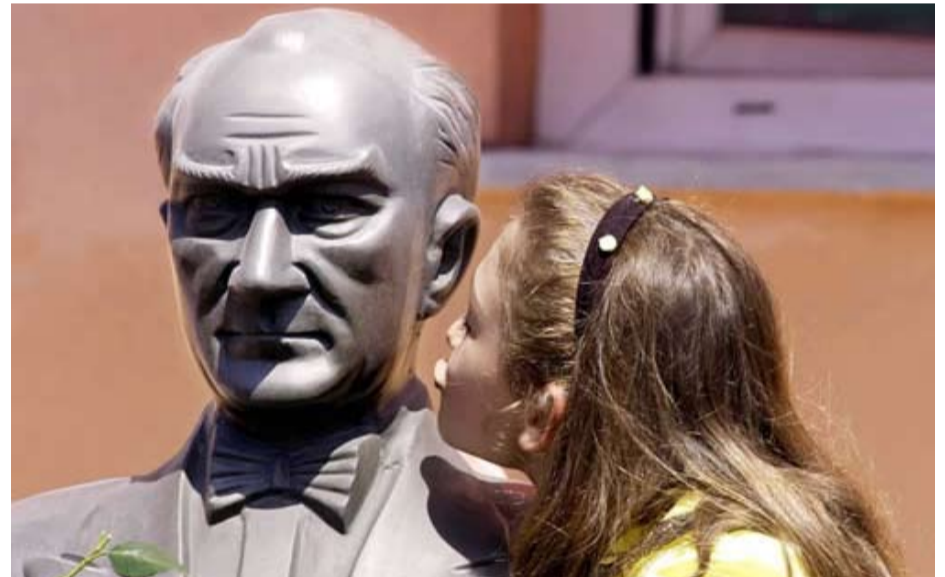
Une statue de Kemal ATATURK leader adoré par le peuple turc

Alger, le 23 juillet 2007... Mon attention s'est toujours focalisée depuis mon adolescence sur l'épopée de la Turquie moderne sous la conduite de Mustapha Kemal ATATURK. Sans doute comme tous les jeunes Musulmans algériens ai-je nourri de la prévention contre la propension excessive de ce leader d'exception à effacer les traces de la civilisation islamique dans la matrice identitaire du peuple turc. Mais comment ne pas nourrir de l'admiration pour cet officier que son amour passionné pour la patrie avait conduit à prendre la direction de ce qui sera au total plus qu'une rébellion, une véritable révolution. Par la suite, l'influence de Kemal ATATURK se perpétuant dans la Turquie moderne, ce fut toujours par référence à son héritage que seront ordonnées les relations complexes des forces armées turques à la société politique, et à la société tout court, dans ce pays au dynamisme exultant. Mises à l'épreuve du terrain, ces relations complexes ont conduit à l'éclosion d'un modèle institutionnel à bien des égards unique. De la personnalité puissante de Kemal ATATURK, du génie avéré du peuple turc ou des contraintes intangibles de l'environnement géopolitique immédiat de ce pays, quelle est donc la donnée fondamentale qui explique la réussite inattendue du modèle institutionnel que j'évoquais ? Un pays résolument porté vers le développement économique dans le cadre d'un système démocratique de plus en plus consolidé avec -coexistant