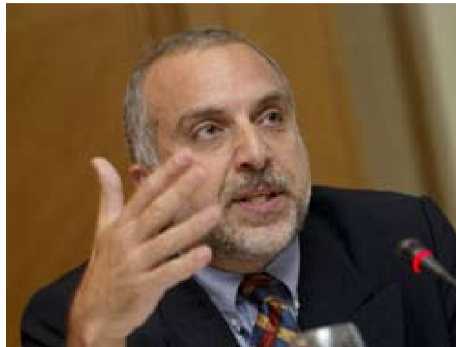
Le professeur Soli OZEL en conférence

S.O : L'économie de marché a complètement transformé l'économie turque. 2001, tout particulièrement, l'économie turque s'est encore plus ouverte