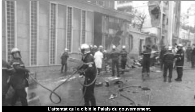
L'attentat qui a ciblé le Palais du gouvernement.