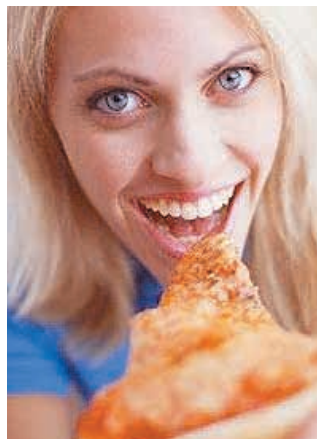
rythme du corps et les besoins réels de l'organisme. Ainsi, au bout de vingt minutes, la

VRAI. En prenant son temps, on respecte le