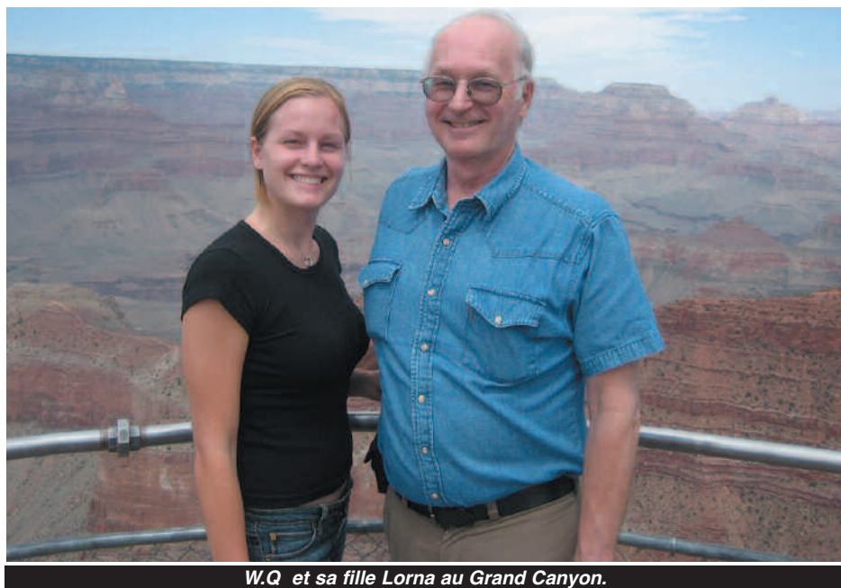
W.Q. et sa fille Lorna au Grand Canyon.

WQ : Je pense qu'il est trop tôt pour tirer des conclusions. Une Egypte plus démocratique sera moins encline à coopérer avec Israël réprimant les Palestiniens. Une Egypte ou les frères musulmans gagneraient plus de voix soutiendra, probablement, plus Hamas. Israël a des raisons pour s'inquiéter même si elle reste, militairement, plus forte par rapport à n'importe quelle combinaison de forces, alentour. Peut être que le bon sens prévaudra et Israël réalisera que le moment est venu pour faire une offre généreuse à la fois pour la Syrie et pour les Palestiniens. Mais j'en doute.