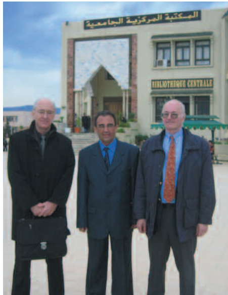
W.Q. en visite à l'Université de Tlemcen en Avril 2007.