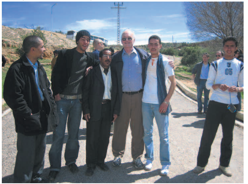
W.Q. avec un groupe d'Algériens à la Qalaa des Ben Salama, lieu où Ibn Khaldoun a écrit la Muqaddima.

MCM : Globalement, les Etats-Unis sont-ils en compétition avec l'Union Européenne et,