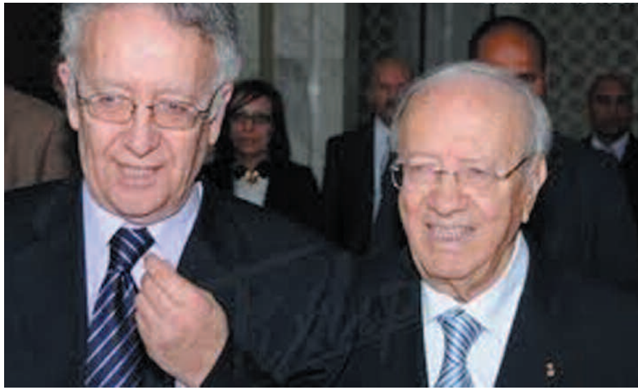
Yadh Ben Achour en compagnie de Béji Caïd Essebsi.

Ce n'est pas avec des salafismes étroits et des nationalismes revanchards exacerbés que nous arriverons à résoudre nos problèmes. La «deuxième Fatiha» constitue un appel en ce sens. Elle cherche à mettre en relief l'humanisme de notre patrimoine culturel et religieux au service de la modernisation de notre pensée, condition de la modernisation de notre civilisation matérielle. Faire du moderne avec le Coran, cela est possible, mais à