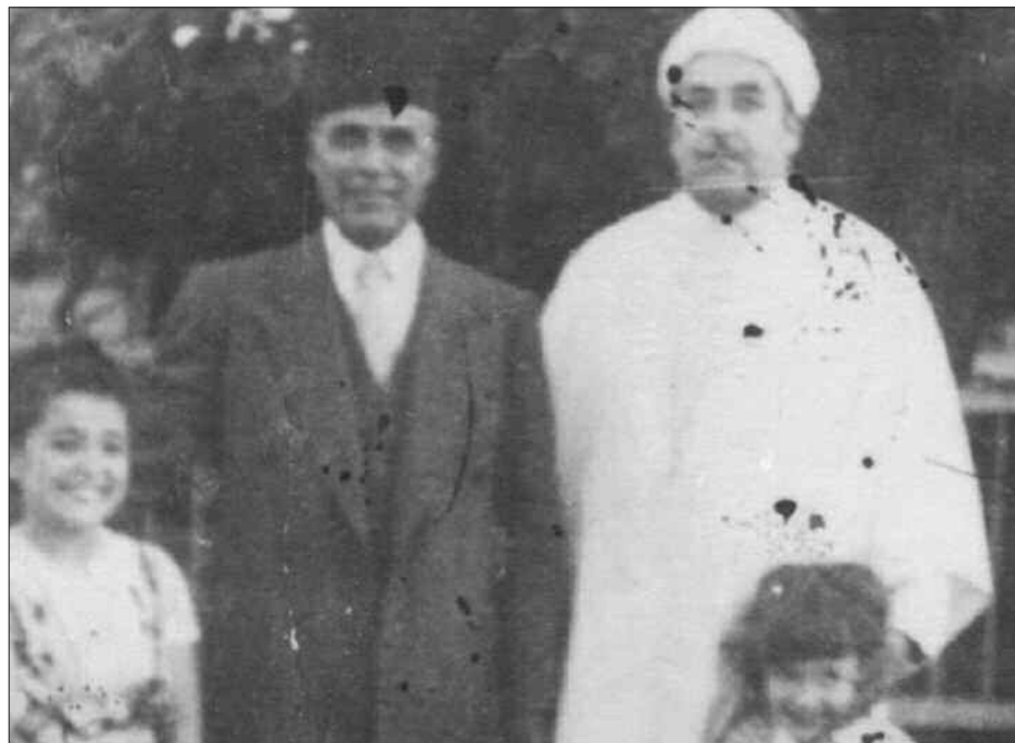
Yadh Ben Achour, enfant, aux côtés de son père et du Président Habib Bourguiba.

Au total, la chute du régime du président Ben Ali, c'est, selon vous, l'échec