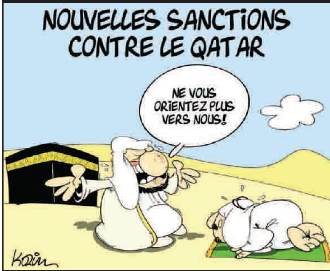
Le dessin de Karim

OUI : 85,5% NON : 8,4% S. OPINION : 6,1%