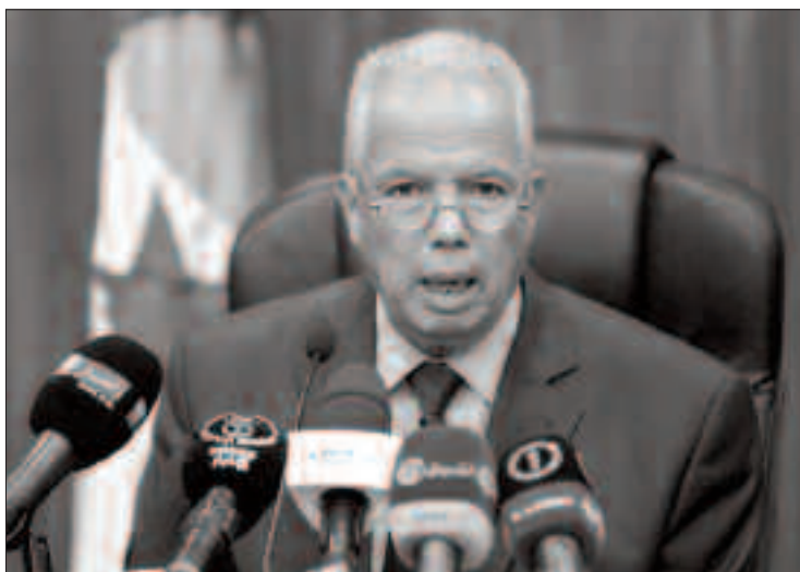
Nedjadi Messeguem, inspecteur général du ministère de l'Éducation.

Le ministère de l'Éducation, a indiqué l'intervenant, ne peut pas connaître avec exactitude le nombre total des retardataires. Le chiffre de 1 815 est seulement celui des candidats ayant protesté pour dire qu'ils sont venus en retard. Selon lui, il pourrait y avoir aussi des retardataires parmi les candidats comptabilisés comme étant des absents mais