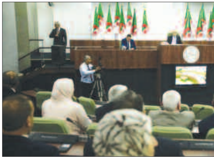
L'agenda du gouvernement sera respecté.