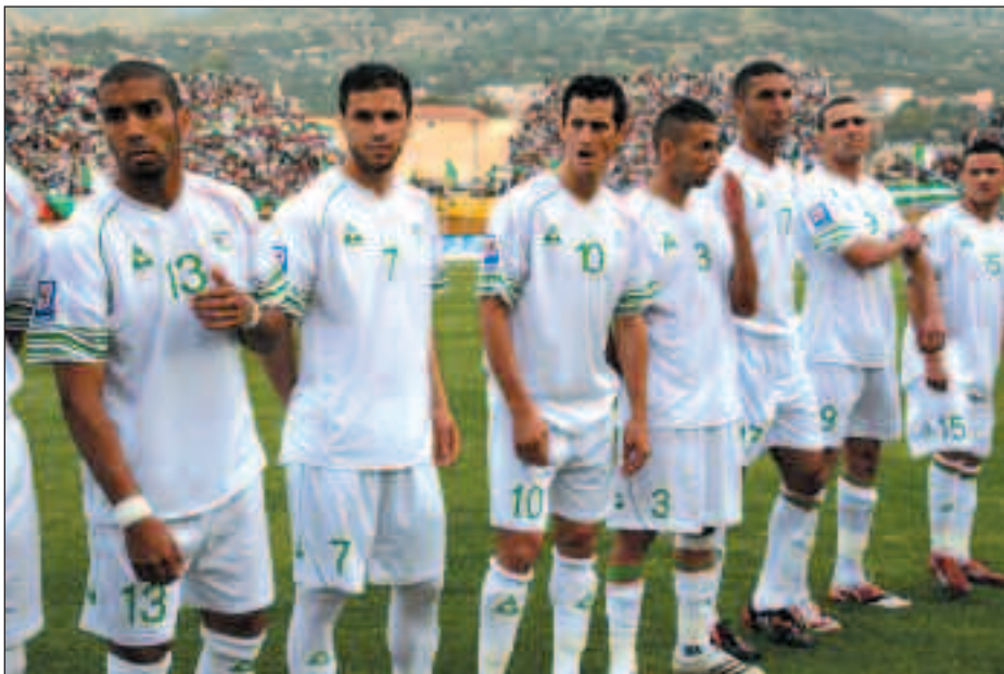
Les Verts veulent entamer positivement ce premier rendez-vous.