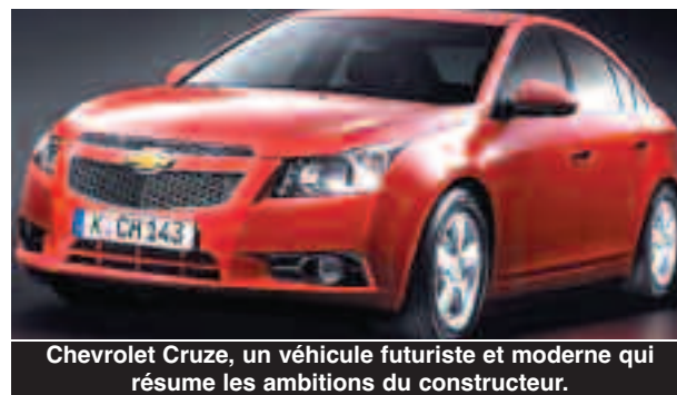
Chevrolet Cruze, un véhicule futuriste et moderne qui résume les ambitions du constructeur.

cette affolement circonstanciel ne justifie nullement la réaction démesurée des autorités. En décidant d'arrêter le crédit, les autorités n'ont pas empêché pour autant les Algériens d'acquiescer encore des véhicules neufs et en les payant cash. Souvent, ils s'endettent auprès de la famille ou de connaissances ou vendent des biens pour s'offrir ce moyen de mobilité important et s'exposent ainsi à plus de précarité financière dans l'avenir immédiat. Les autorités devraient plutôt relancer le crédit tout en instituant un système de régulation et de sélection. Car il y a un véritable besoin du véhicule tant au niveau des particuliers que chez les entreprises en raison des nombreux et grands projets initiés à travers l'Algérie. Autant de besoins qui doivent être satisfaits et pour lesquels il serait préférable d'engager des discussions avec les concessionnaires et parvenir ensemble à des solutions qui prennent en compte les intérêts des uns et des autres.»