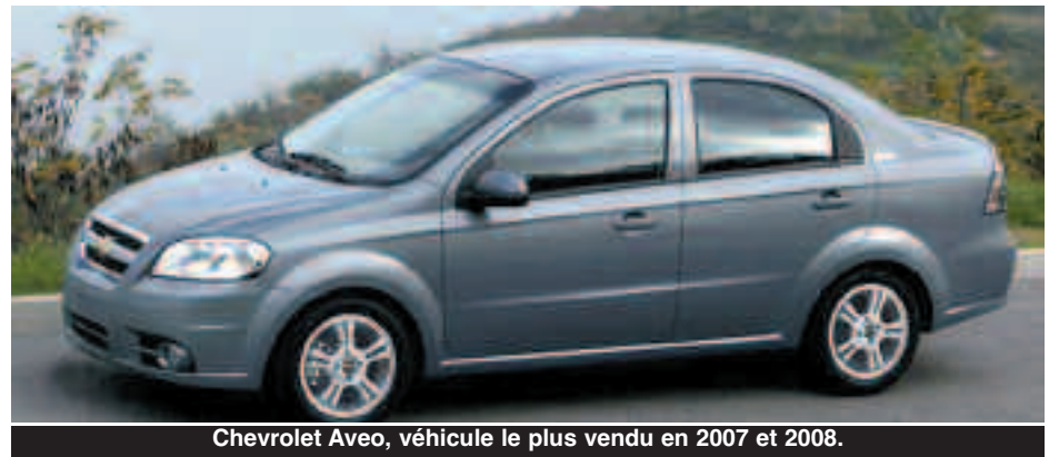
Chevrolet Aveo, véhicule le plus vendu en 2007 et 2008.