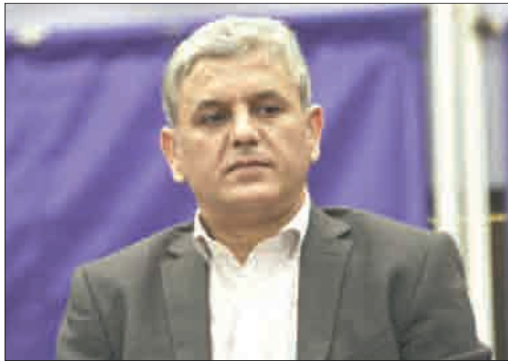
Le parti de Belabbès met le paquet pour réussir cette commémoration.

Comme d'habitude, une formule de Saïd Sadi résume si bien l'équation : « Congrès de la Soummam :