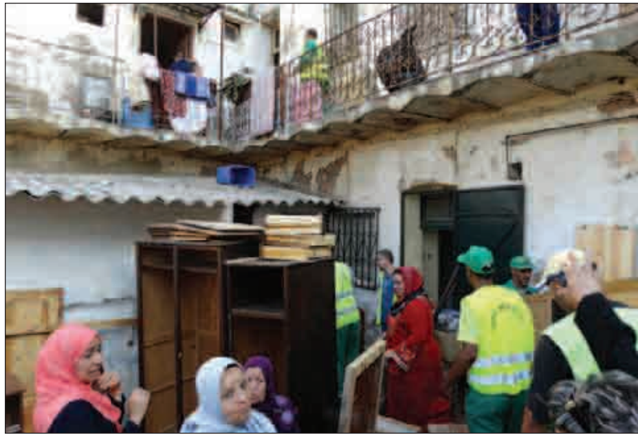
Le séisme du 1 er août a causé des dégâts au vieux bâti.