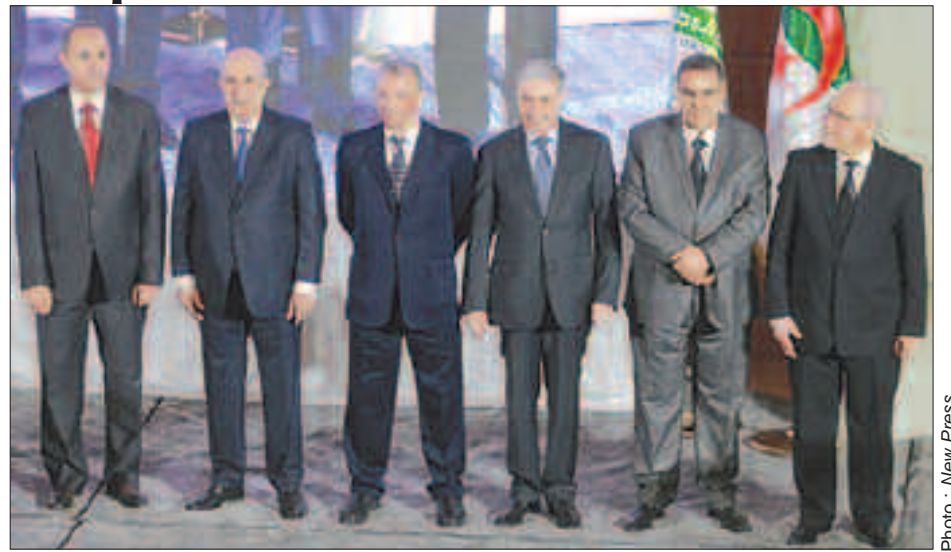
Les 5 candidats ont 3 semaines pour séduire et convaincre.

S'engageant au préalable, publiquement et par la voix de son premier responsable, le chef d'état-major et vice-ministre de la Défense nationale à n'avoir ni « d'ambitions politiques personnelles », ni l'intention de présenter ou soutenir un candidat, l'armée